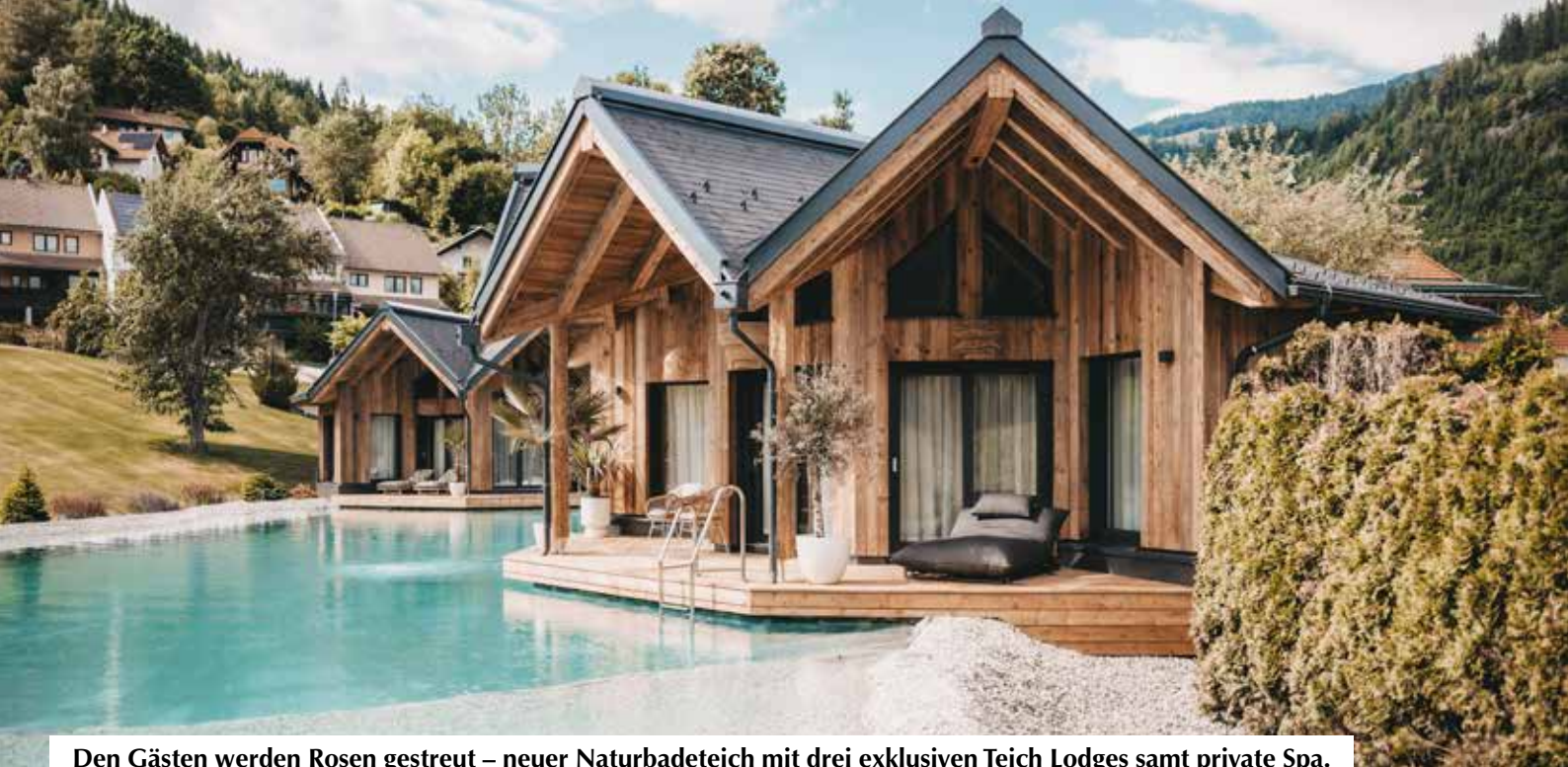
Den Gästen werden Rosen gestreut – neuer Naturbadeteich mit drei exklusiven Teich Lodges samt private Spa.